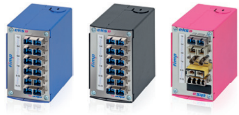
Verschiedene Gehäusefarben und Kupplungsvarianten